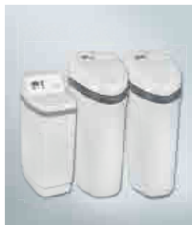
Станции водоподготовки Aquahome 10-N, 20-N и 30-N