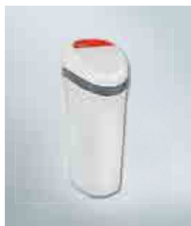
Станция водоподготовки Aquamix-N